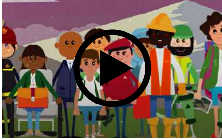
ODS 8 | UNESCO Etxea