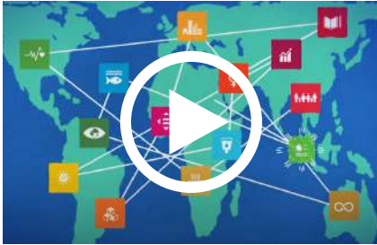
ODS 17 | UNESCO Etxea