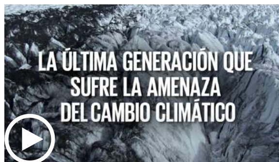
Plan (Spanish) | The Global Goals