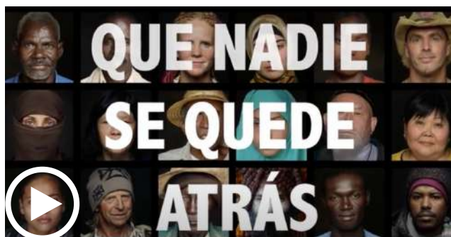
Leave No One Behind (Spanish) | The Global Goals

Podremos tomar estos videos como detonantes para activa la motivación entre los grupos: