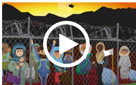
ODS 16 | UNESCO Etxea