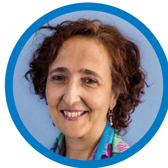
Sagrario Martín Presidenta de Médicos del Mundo